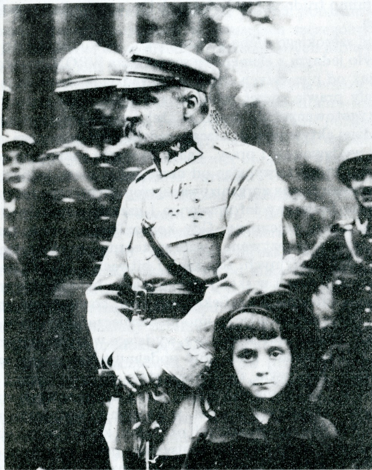
Marszałek J. Piłsudski z córką Wandą.