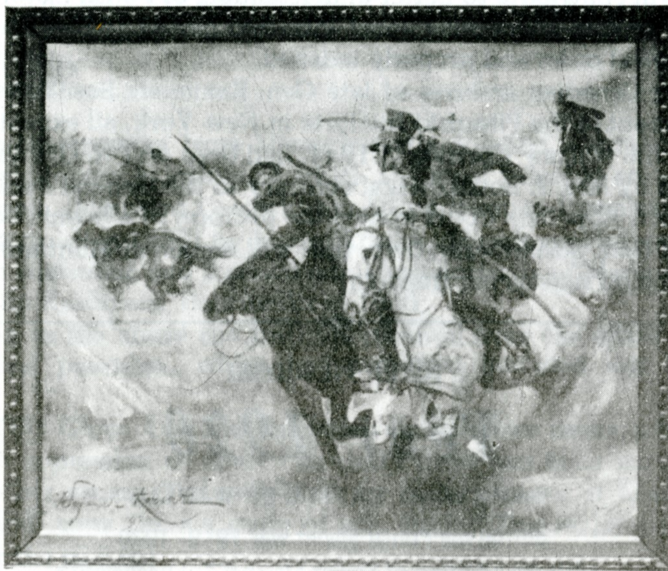
Wojciech Kossak "Potyczka".