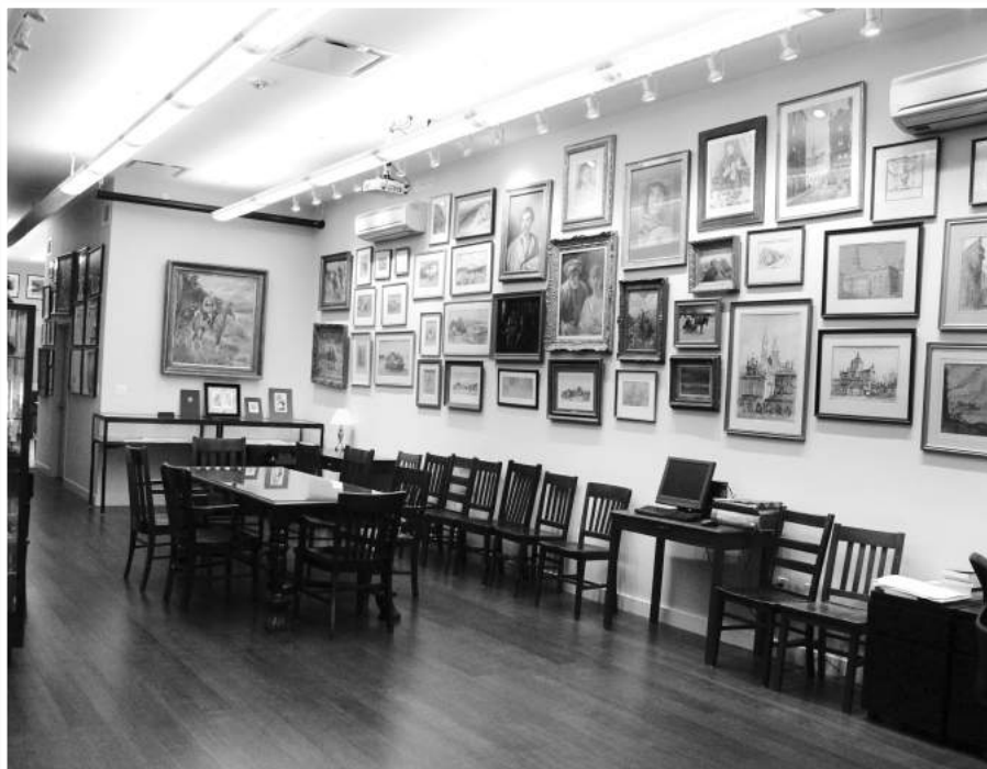
» Galeria Instytutu

dą otwarte dla wszystkich zainteresowanych. Zapraszam więc do odwiedzenia Instytutu, wzięcia udziału w spotkaniach otwartych i darmowych dla publiczności. Bardzo proszę o wspieranie naszej działalności, zachęcanie rodziny i przyjaciół do zainteresowania Instytutem. Nasze polskie dziedzictwo narodowe wymaga opieki, wsparcia i mądrej edukacji. Na koniec powtórzę za Patronem Instytutu: "Kto nie szanuje i nie ceni swojej przeszłości, ten nie jest godzien szacunku, terażniejszości ani prawa do przyszłości".