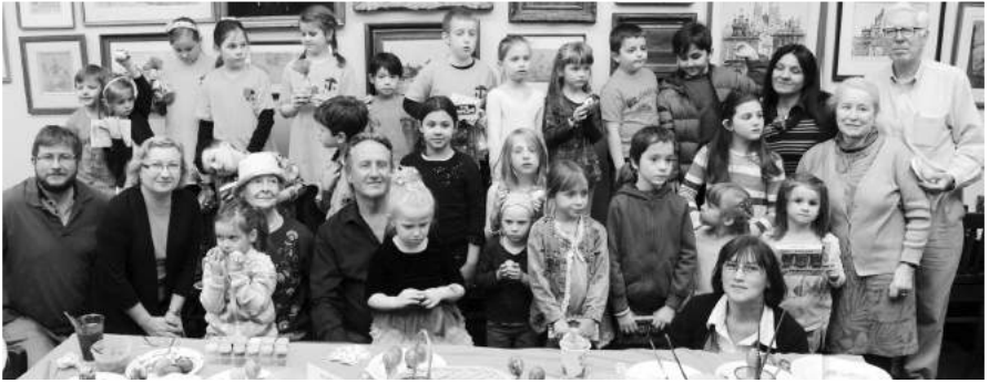
» Uczestnicy warsztatów