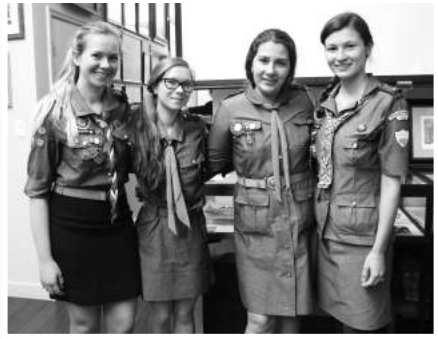
» Harcerki z drużyny "Górski Las"