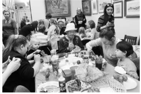
» Malujemy pisanki

zwykle pomysłowe pisanki. Ogłoszony został konkurs na najładniejszą pisankę tradycyjną i współczesną. Ufundowano trzy pierwsze nagrody (ogromne czekoladowe zajace) za najciekawsze dziecięce „dzieła” i cztery nagrody książkowe dla dorosłych. Wykonane przez naszych milusińskich pisanki były bardzo różnorodne i kolorowe i zasługiwały na wyróżnienie, dlatego wszystkie dzieci otrzymały słodkie upominki. Uczestnicy warsztatów dziękowali za zorganizowanie tego przedsięwziętego spotkania i prosili o następne w przyszłym roku.