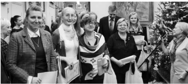
» Wolontariusze Instytutu na „Gwiazdce”

» 13 grudnia 2015 r. - „Gwiazdka” dla przyjaciół i sponsorów Instytutu.