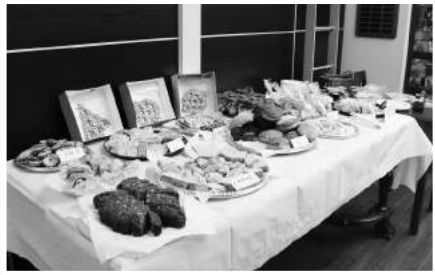
» "Bake sale for Giving Tuesday"

» 1 grudnia 2015 r. - Instytut Piłsudskiego po raz pierwszy brał udział w ogólnościatowej akcji "Giving Tuesday". Tego dnia zachęca się zarówno osoby indywidualne jak i firmy do przekazywania darowizn na rzecz organizacji charytatywnych. W naszej galerii zorganizowaliśmy "Bake sale for Giving Tuesday" oferując wypieki sporządzone przez pracowników i wolontariuszy Instytutu oraz darowane przez piekarnie z Greenpointu,