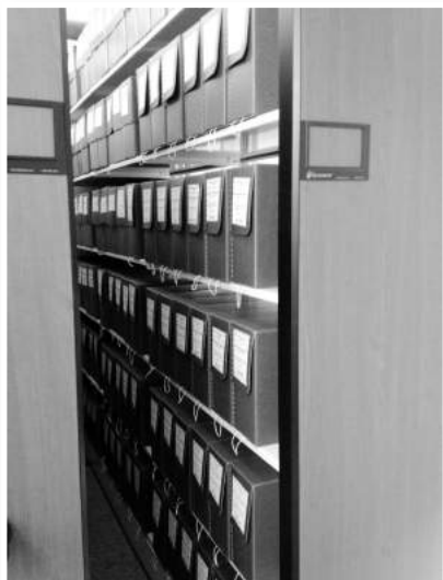
» Archiwum Instytutu