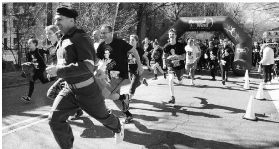
» Bieg Pamięci Żołnierzy Wyklętych: Start

28 lutego, 2016 r. w parku miejskim Forest Park na Queensie Instytut Piłsudskiego w Ameryce przy współpracy z organizacją polskich biegaczy “Polska Running Team” zorganizował po raz pierwszy w metropolii nowojorskiej bieg “Tropem Wilczym. Bieg Pamięci Żołnierzy Wyklętych”. Prezes “Polska Running Team”