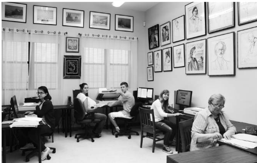
» Wolontariusze przy pracy