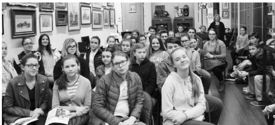
» Młodzież uczestnicząca w lekcji historii