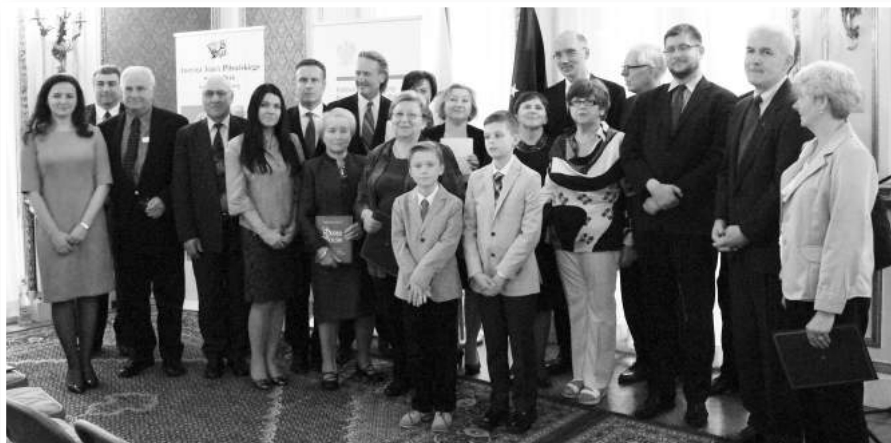
» Obchody 1050 rocznicy chrztu Polski