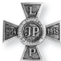
» Odznaka Instytutu - replika Krzyża Legionowego