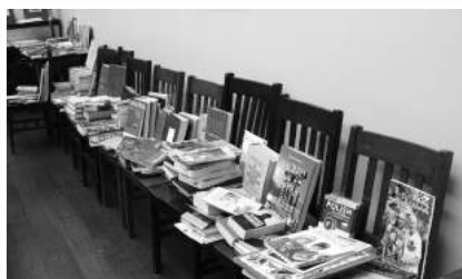
» Kiermasz książek i dzieł sztuki