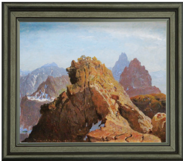
» Wojciech Gerson (1831-1901) "Rysy w Tatrach", olej na desce, sygnowany i datowany, 1895, 21x26cm.