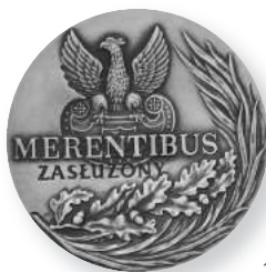
» Medal Merentibus

W 2003 roku Komitet Organizacyjny obchodów 60-lecia Instytutu Piłsudskiego w Ameryce postanowił w roku jubileuszowym odznaczyć osoby, które swoją pasją i zaangażowaniem bezinteresownie poświęciły swój wolny czas na działalność w Instytucie. Podjęto decyzję ustanowienia prestiżowego medalu przyznanego za szczególne zasługi położone dla rozwoju i działalności tej placówki.