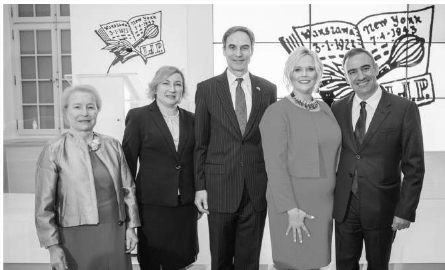
» Gala Coca Coli - przedstawiciele Instytutu i nagrodzonych firm

Nagroda Corporate Catalyst jest elementem promocji Kampanii na rzecz Przyszłości, międzynarodowej akcji, której celem jest zapewnienie długoterminowej stabilności Instytutu, aby mógł on kontynuować swoją misję opieki nad spuścizną narodową, oraz promocji polskiej kultury i historii w Stanach Zjednoczonych.