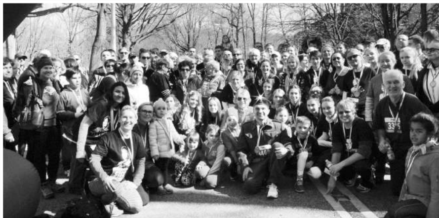
» Wspólne zdjęcie uczestników

Instytut Piłsudskiego zapowiedział organizację biegów w następnych latach i ma nadzieję na jeszcze większy udział tych, którzy zechcą oddać hołd Żołnierzom Niezłomnym - ich ofiara życia dla Ojczyzny nie może być zapomniana. Instytut dziękuje wszystkim, którzy poparli tę ważną ogólnopolską i międzynarodową akcję.