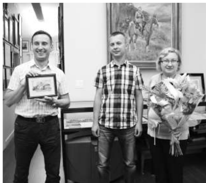
» Dziękujemy pracownikom IPN za ich pomoc