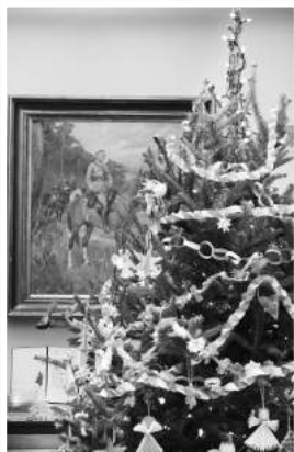
» Nasza choinka ustrojona w tradycyjne ozdoby