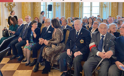
Gala na Zamku Królewskim w Warszawie.