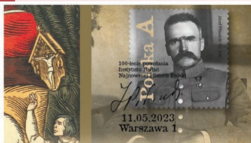
Kartka pocztowa z okazji setnej rocznicy powołania Instytutu Badań Najnowszej Historii Polski