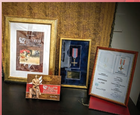
Krzyż Służby Niepodległości dla Instytutu Józefa Piłsudskiego w Ameryce oraz kartka pocztowa z okazji setnej rocznicy powołania Instytutu Badań Najnowszej Historii Polski.