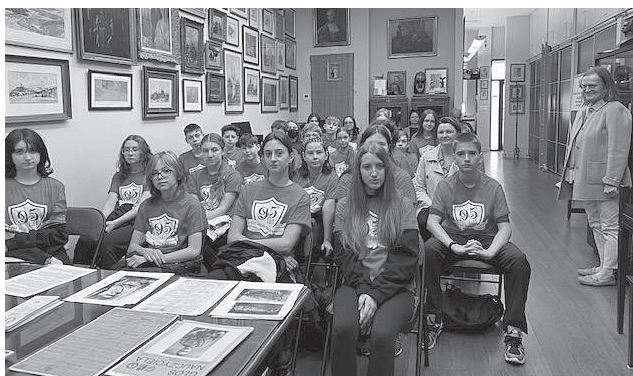
Lekcja historii dla uczniów z Polskiej Szkoły Doksztalczącej im. Henryka Sienkiewicza