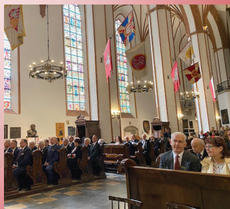
Msza św. w Archikatedrze Rzeczypospolitej pw. Św. Jana Chrzciciela.