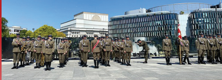
Złożenie kwiatów w asyście wojskowej pod Grobem Nieznanego Żołnierza.