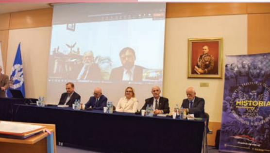
Akademia Sztuki Wojennej – debata historyczna pt. Instytuty Józefa Piłsudskiego w służbie Niepodległej