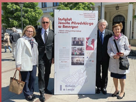
Wystawa historyczna o Instytutach Piłsudskiego na Krakowskim Przedmieściu.