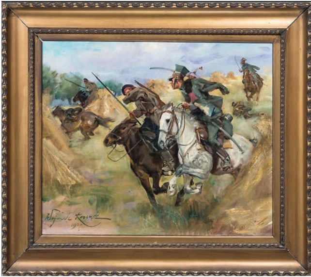
Wojciech Kossak (1857-1942) „Potyczka”