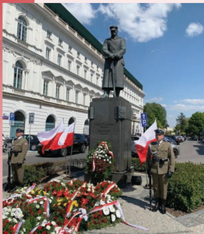
Pomnik Józefa Piłsudskiego w Warszawie.