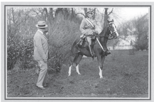
Józef Piłsudski na Kasztance i malarz Wojciech Kossak

W sierpniu 2022 zamieściliśmy na stronie internetowej unikalne fotografie Marszałka Józefa Piłsudskiego, na których można zobaczyć Marszałka w okresie dzieciństwa i młodości a także w późniejszym czasie Legionów i momencie formowania się państwa polskiego po 1918 r.