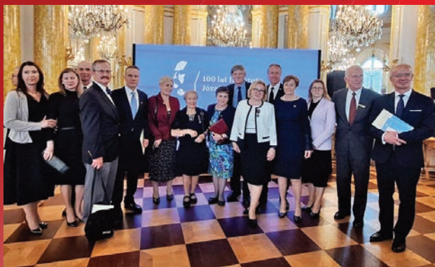
Członkowie Rady Instytutu, goście i nagrodzeni.