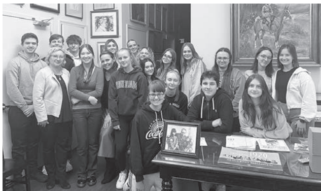
Lekcja historii – dla uczniów z Polskiej Szkoły Sobotniej przy parafii Św. Cyryla i Metodego