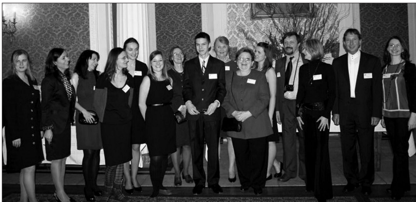
Wolontariusze pomagają przy organizacji uroczystości Instytutu.

Wolontariusze przechodzą szkolenia związane z wykonywaniem różnych zadań w Instytucie, takich jak wprowadzanie danych do komputera, prace archiwalne, biblioteczne i biurowe. Zapraszamy wszystkich chętnych do pomocy w naszej placówce.