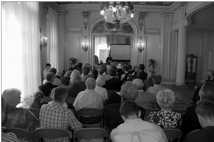
Wieczór historii i muzyki na cześć Ignacego Jana Paderewskiego i Fryderyka Chopina