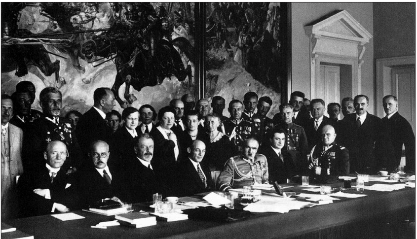
Czwarte plenarne posiedzenie Rady Naukowej Wychowania Fizycznego pod przewodnictwem Marszałka J. Piłsudskiego w Warszawie w dniu 22 V 1932 r.