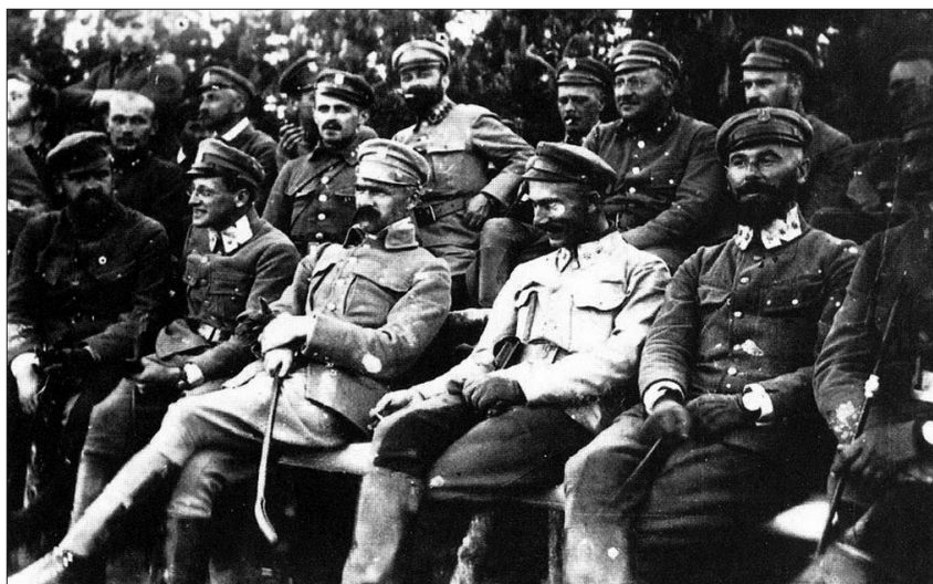
Mecz piłkarski pod Nową Rarańczą w dniu 30 VI 1916 r.