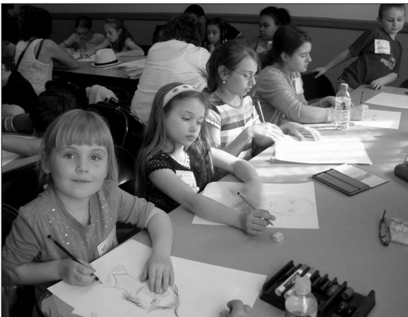
Dzieci rysują portret Mamy

Z okazji Dnia Matki, w dniach 1 i 8 maja 2010 r. odbyły się w Instytucie warsztaty i konkurs rysunkowy pod hasłem Portret Mamy, który miał być niecodziennym podarunkiem dla matek z okazji ich święta. Do uczestnictwa w tym wydarzeniu zaproszone zostały, poprzez anonse w prasie polonijnej i mediach, dzieci w wieku od 6 do 14 lat. Warsztaty prowa-