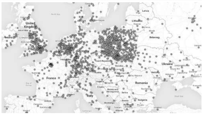
» Rozrzut geograficzny czytelników strony Archiwa Online (część Euro-py).

Oprócz bieżącej digitalizacji prowadzimy również inne projekty: