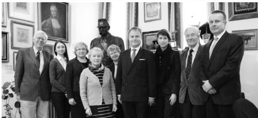
» Artur Nowak-Far - Podsekretarz Stanu, Ministerstwo Spraw Zagranicznych (w środku).