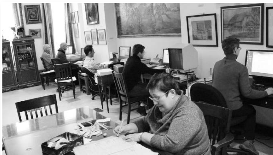
» Praca nad digitalizacją dokumentów archiwalnych.

Instytut kontynuuje rozpoczęty w roku 2008 program digitalizacji zasobów archiwalnych. Digitalizacja jest złożonym procesem, i w miarę nabywania doświadczenia, pozyskaliśmy pomoc wolontariuszy, którzy wyspecjalizowali się w przygotowaniu, konserwacji i paginacji archiwów, w skanowaniu stron dokumentów, opisywaniu dokumentów w programie Dspace, wymagającym zrozumienia treści i wybrania kluczowych informacji z każdego tekstu, oraz w korekcie pracy innych, w organizowaniu prezentacji danych na stronie internetowej, w doglądaniu serwerów i automatyzacji tworzenia kopii zapasowych, które są przechowywane poza instytutem, w tworzeniu oprogramowania dla ułatwienia pracy wolontariuszom i stażystom, w opiece i szkoleniu stażystów i wolontariuszy, którzy często spędzają w Instytucie miesiąc lub kilka i wracają do swoich zajęć czy studiów. Oczywiście w zadaniach biorą również udział pracownicy Instytutu.