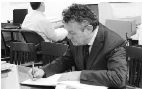
» Ambasador Ryszard Schnepf wpisuje się do książki pamiątkowej Instytutu.