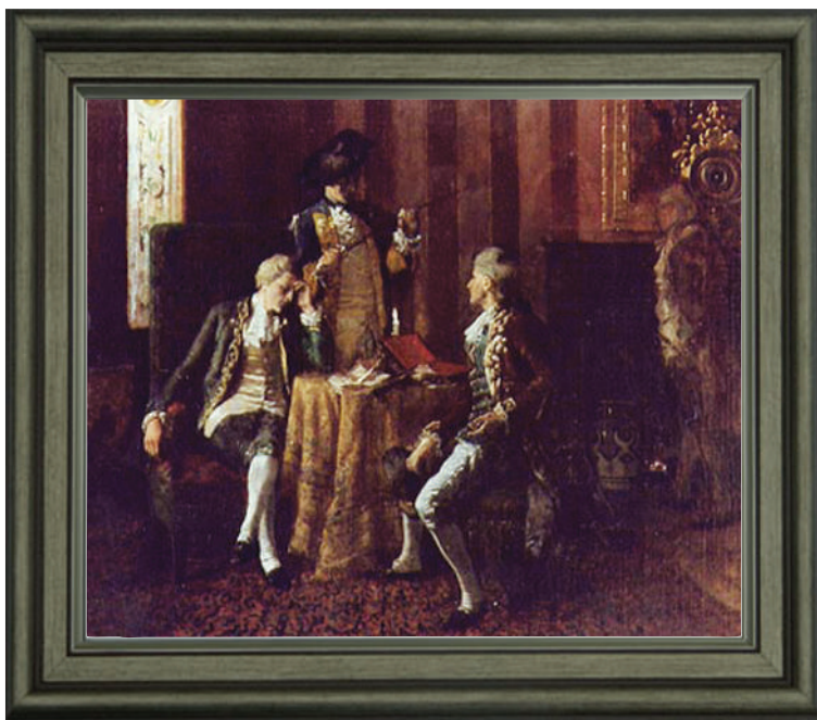
» Gieryski, Aleksander (1850-1901) "Przed pojedyńkiem", Olej na płótnie, sygnowany i datowany, 1870, 44x57.5cm.