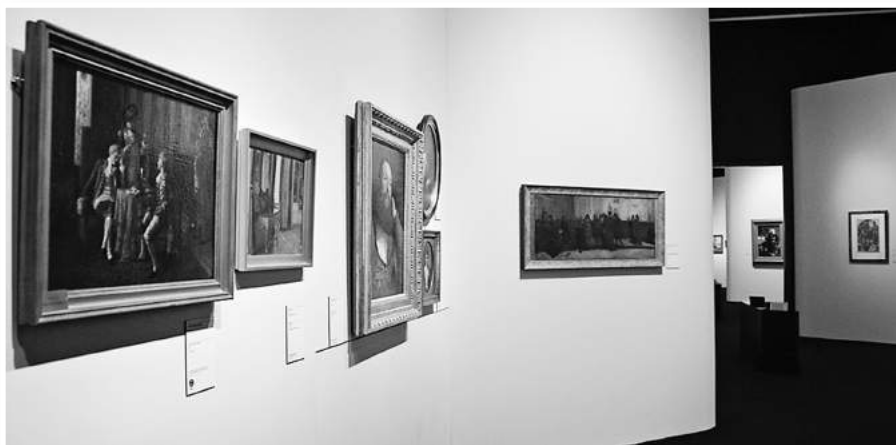
» Obraz „Przed pojedynkiem” A. Gierymskiego na wystawie w Muzeum Narodowym w Warszawie

Obraz z Galerii Instytutu Przed pojedynkiem Aleksandra Gierymskiego został wypożyczony na wystawę jego prac w Muzeum Narodowym. Obraz został pięknie odrestaurowany na koszt Muzeum i powróci do nas jesienią po zakończeniu wystawy.