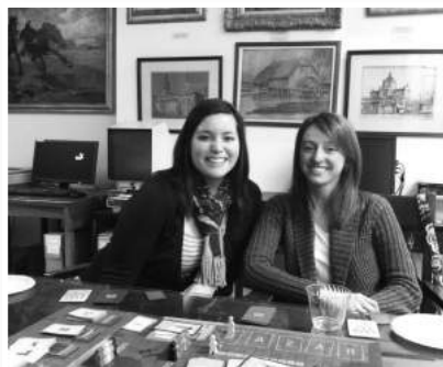
» Ulubiona gra Grupy Młodych „Kolejka”.