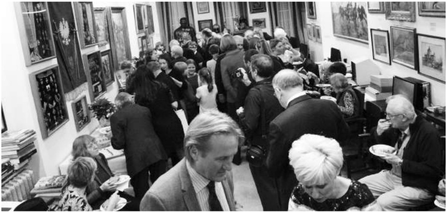
» Gwiazdka 2013.