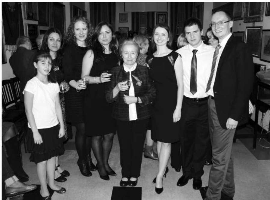
» Wolontariusze biorący udział w programie artystycznym na Święto Niepodległości Polski.