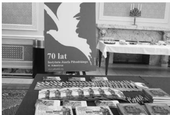
» Targi Edukacyjne w Konsulacie Generalnym RP

To spotkanie na zawsze pozostanie w pamięci zgromadzonych, którzy osobiście spotkali bohaterów - ludzi, którzy nie wahali się narażać życia dla Ojczyzny. Był to wielki zaszczyt dla Instytutu, że mógł gościć tych bohaterskich świadków historii.