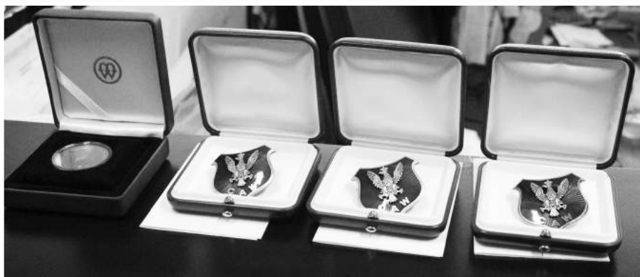
» Odznaki Centralnego Archiwum Wojskowego.