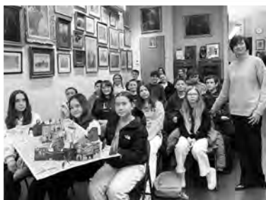
» Polska Szkoła Dokształcająca przy parafii Św. Cyryla i Metodego, Brooklyn