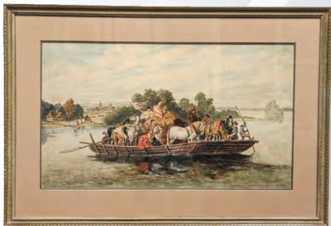
» Juliusz Kossak (1824-1899), Przeprawa rotmistrza pancernego przez Dniestr; akwarela na papierze.