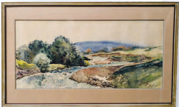
» Julian Fałat (1853-1929), Bystra, potok w górach, akwarela na papierze.