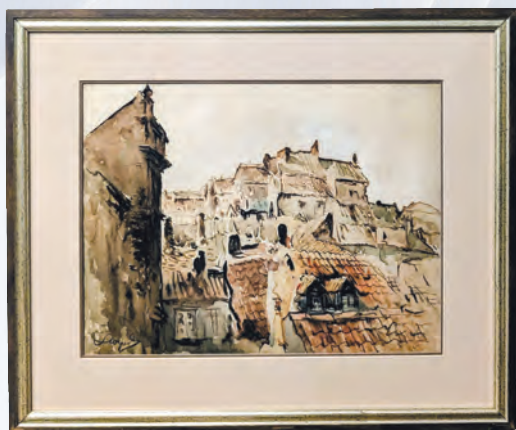
» Leon Wyczółkowski (1852-1936), Dachy starego miasta w Warszawie , akwarela na papierze.

Z radością zawiadamiamy, że sześć prac zostało poddanych gruntownej konserwacji dzięki wsparciu finansowemu Ministerstwa Kultury i Dziedzictwa Narodowego. W ramach programu Wspieranie Archiwów, Bibliotek i Muzeów poza Krajem odrestaurowane zostały następujące dzieła: