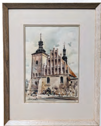
» Leon Wyczółkowski (1852-1936), Kościół Wazyłek w Lublinie , akwarela na papierze.