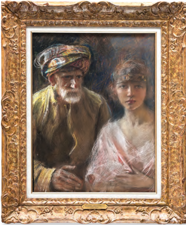
» Teodor Axentowicz (1859-1938) "Starzec i dziewczyna"