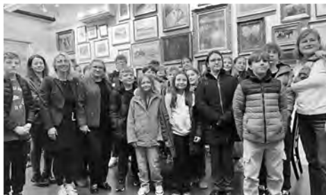
» Szkoła Polska przy Konsulacie Generalnym RP w Nowym Jorku

Serdecznie dziękujemy nauczycielom i uczniom za wspólnie spędzony czas i zapraszamy kolejne klasy do odwiedzenia naszego Instytutu.