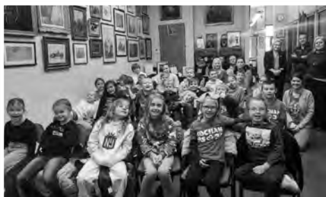
» Klasa 2 z programu dwujęzycznego polsko-angielskiego ze Szkoły Publicznej nr 34.

Od ponad 20 lat Instytut Józefa Piłsudskiego w Ameryce zaprasza dzieci i młodzież na wyjątkowe lekcje historii, przybliżające im losy Polski i Polaków. W roku sprawozdawczym 2024/2025 zorganizowaliśmy łącznie osiem spotkań edukacyjnych. Jesienią gościliśmy uczniów amerykańskiej szkoły publicznej P.S. 34 z Brooklynu, z którą współpracujemy w ramach programu Polish-English Dual Language Program. Wiosną odwiedzili nas uczniowie z trzech polonijnych szkół sobotnich: Polskiej Szkoły przy parafii Św. Cyryla i Metodego na