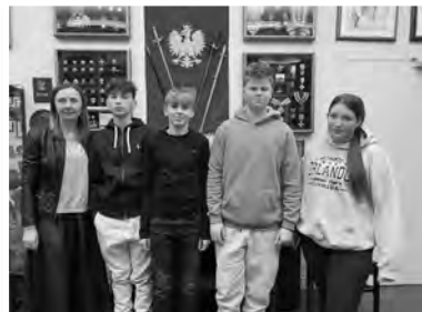
» Klasa 8 – Polska Szkoła Doksztalająca im. I. Paderewskiego