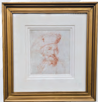
» Daniel Mikołaj Chodowiecki (1726-1801), Głowa polskiego magnata , sangwina na papierze.