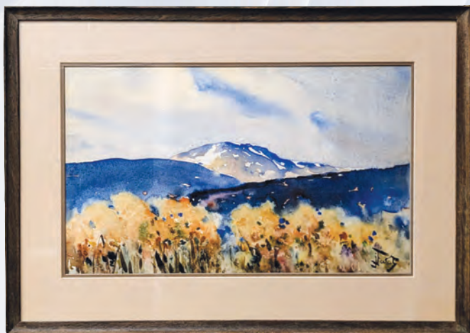
» Julian Fałat (1853-1929), Jesień w górach, akwarela na papierze.